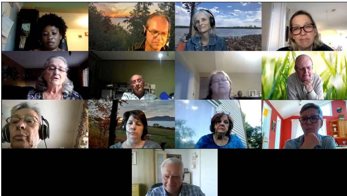
Participants à l'Assemblée générale de juin 2021.

En plus de l'adjointe administrative et du directeur, onze (11) membres ont participé à notre AGA où le rapport d'activités et le rapport financier ont été présentés.