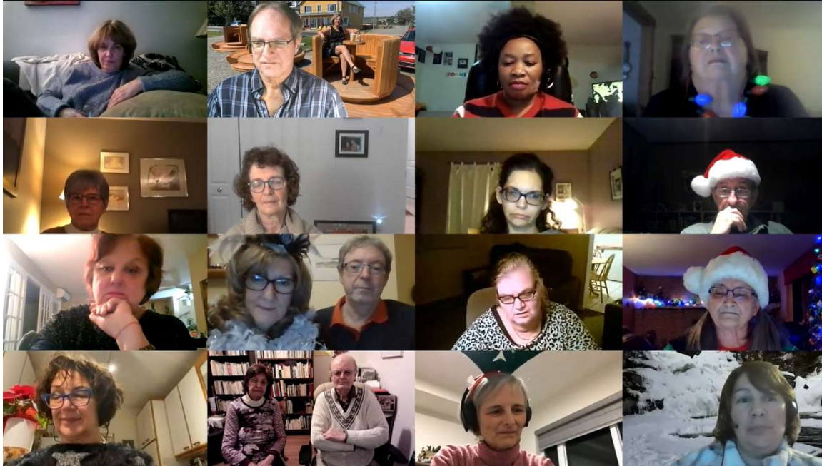
Party des Fêtes des bénévoles par Zoom en janvier 2022.